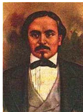
Francisco González Bocanegra