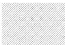
Superficie ó Área